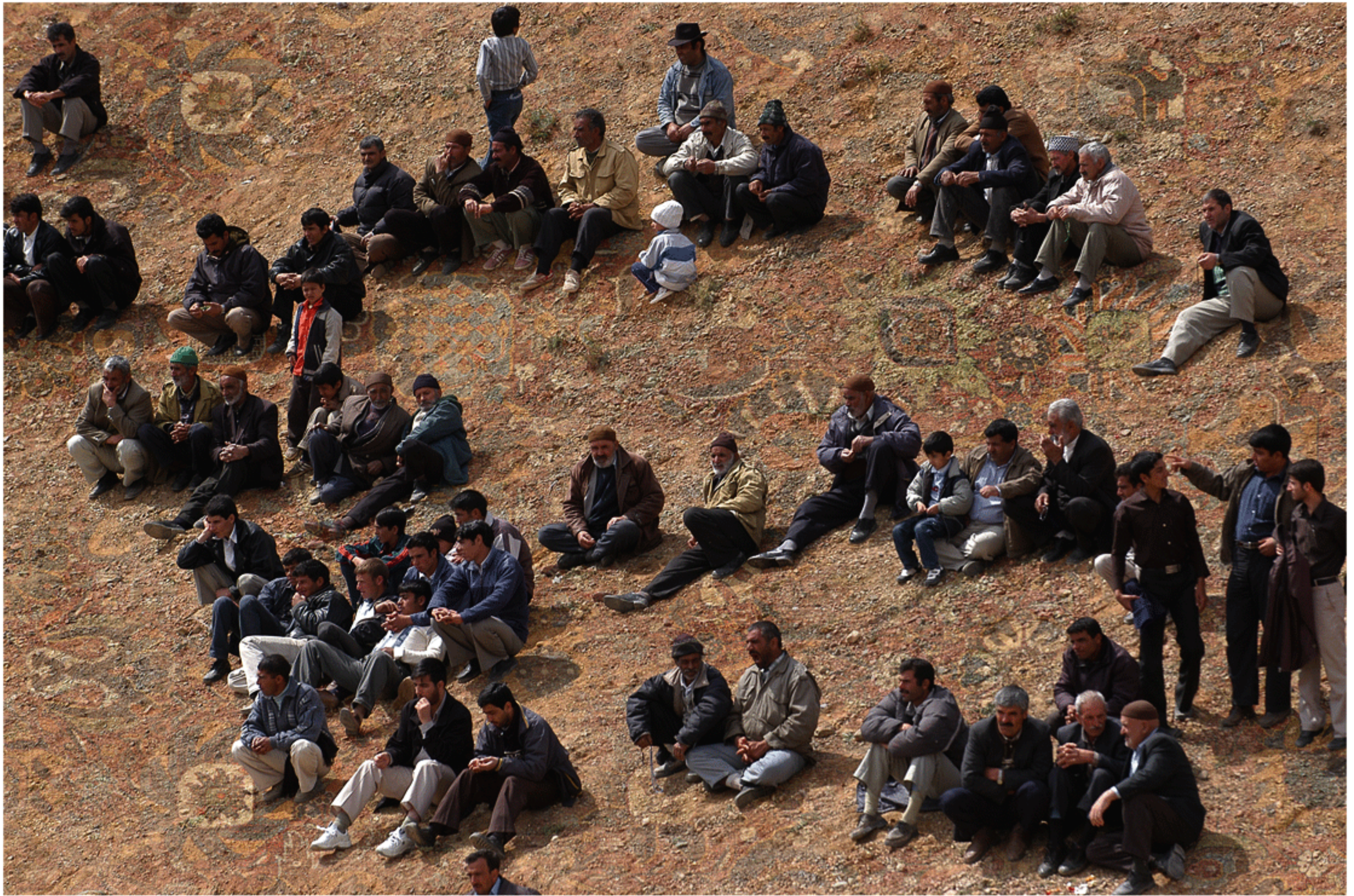
#6 - 75 x 112 cm