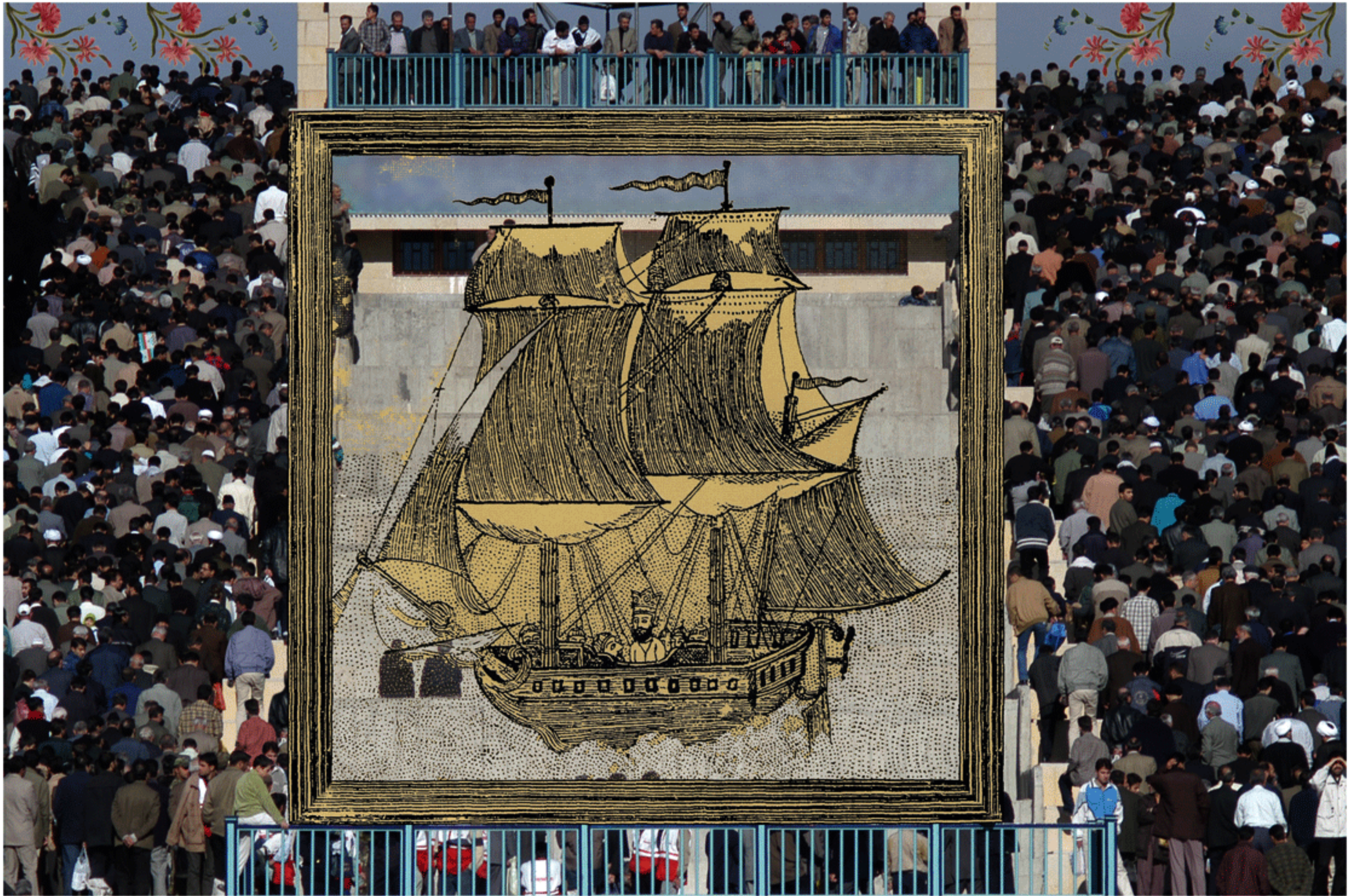
#8 - 75 x 112 cm