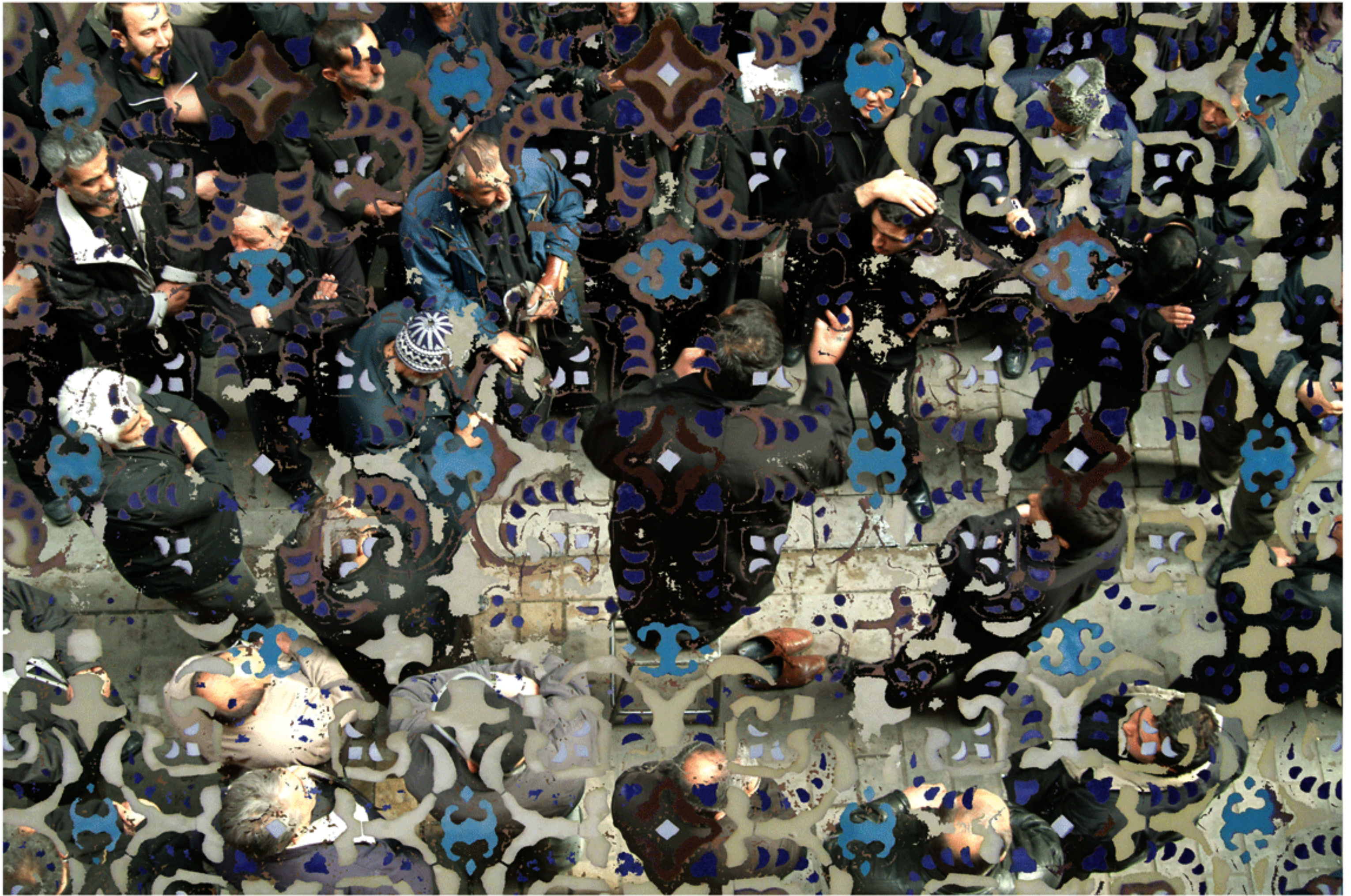
#4 - 75 x 112 cm