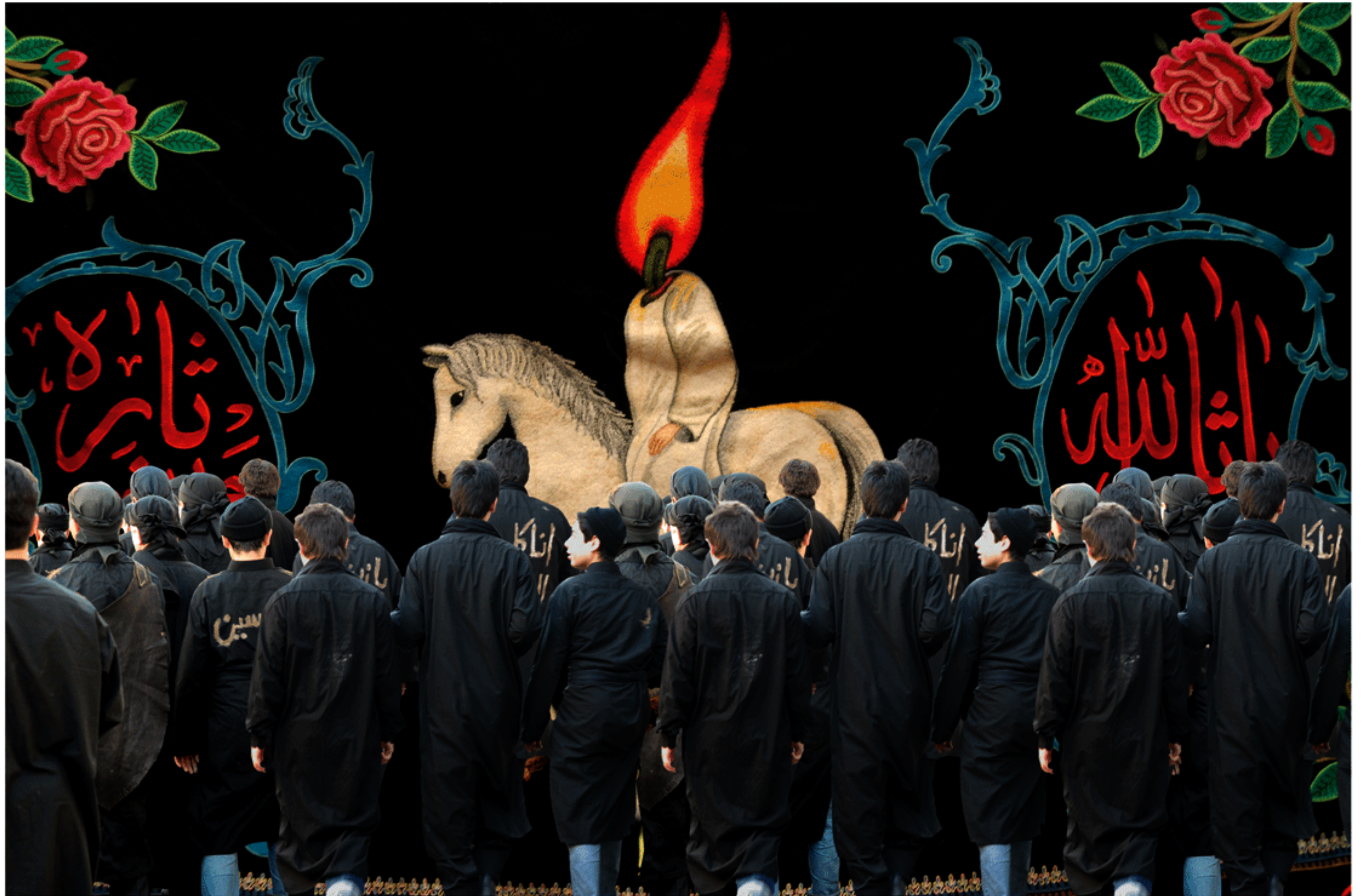
#5 - 75 x 112 cm