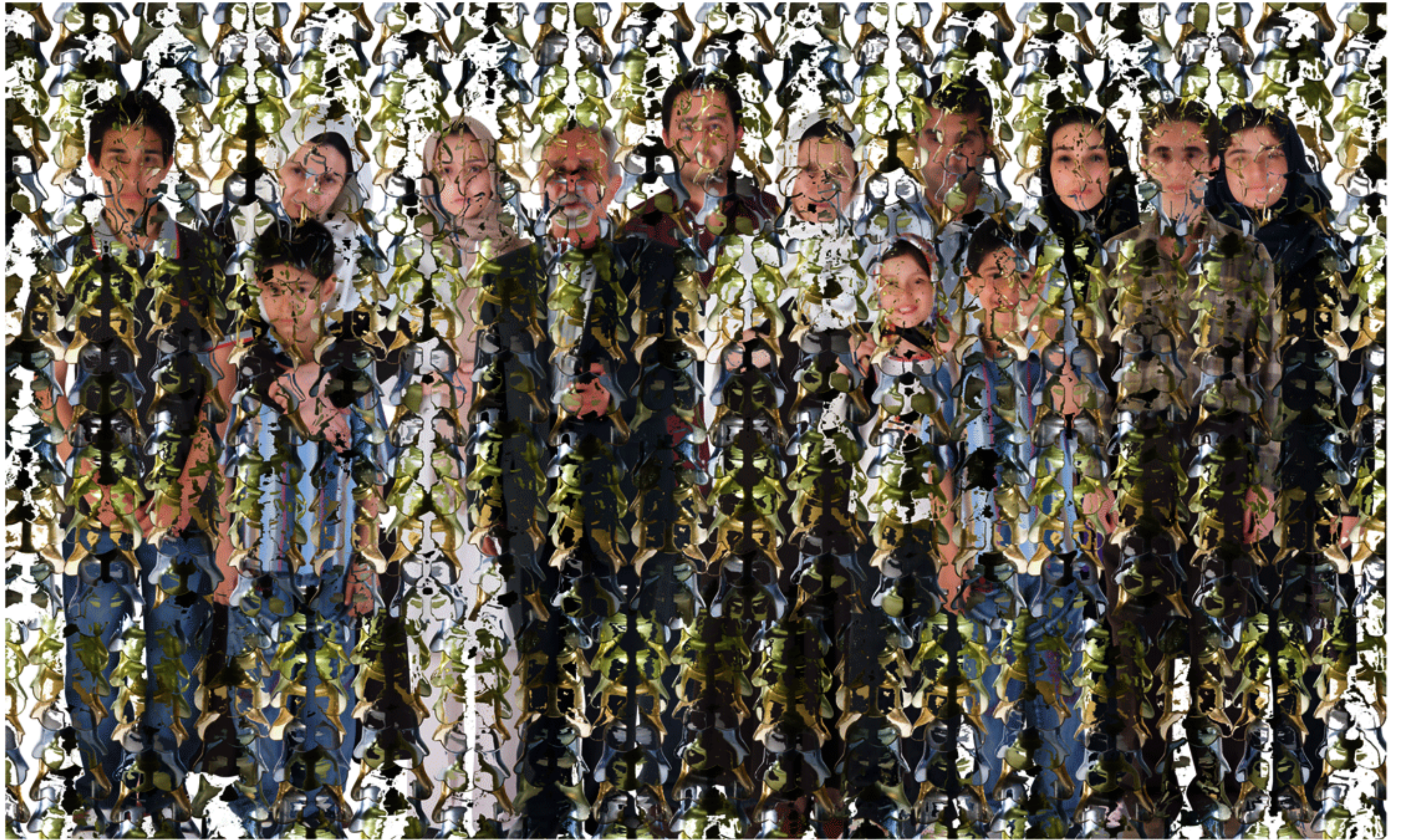
#9 - 75 x 123 cm