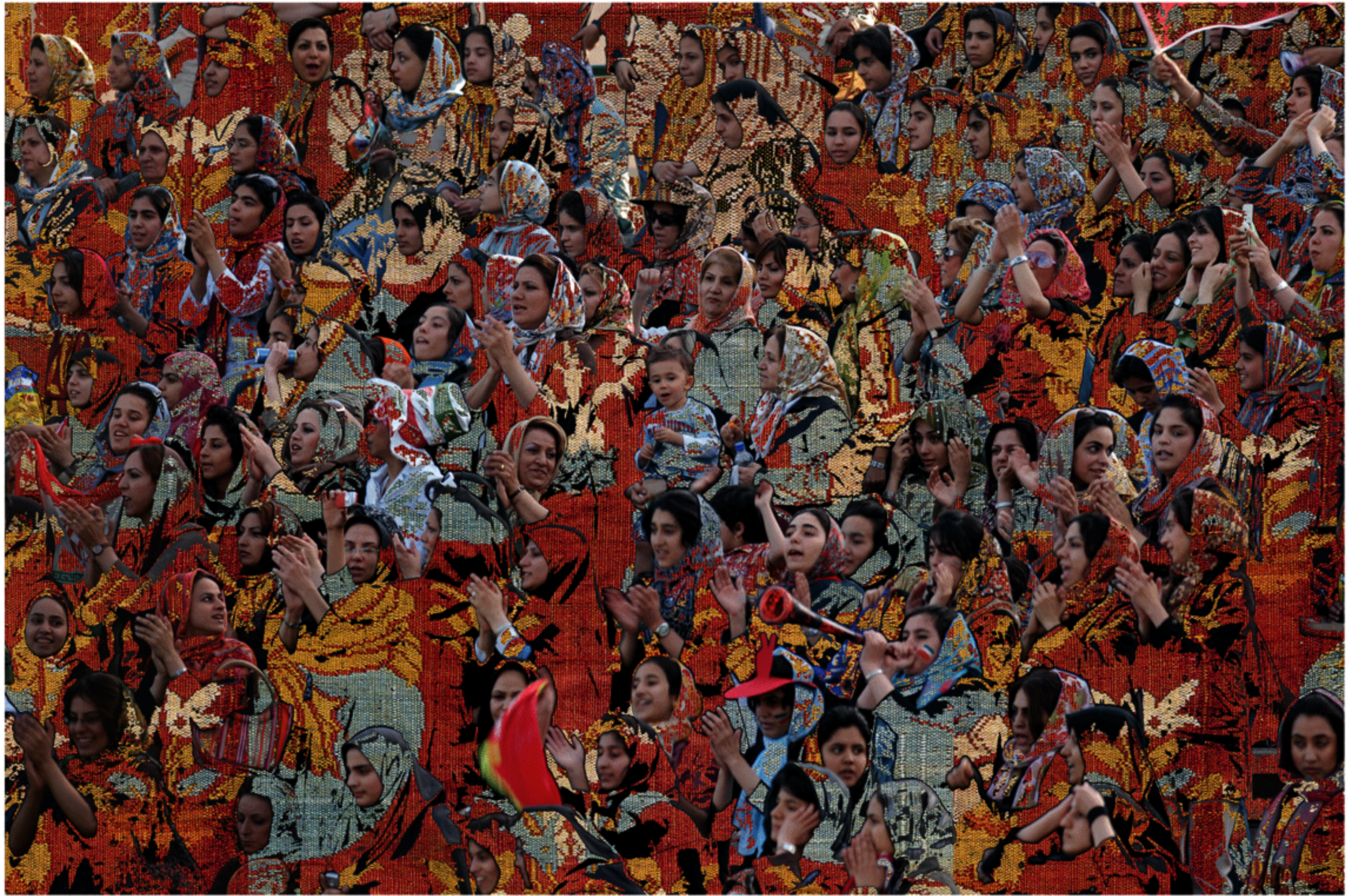
#3 - 75 x 112 cm