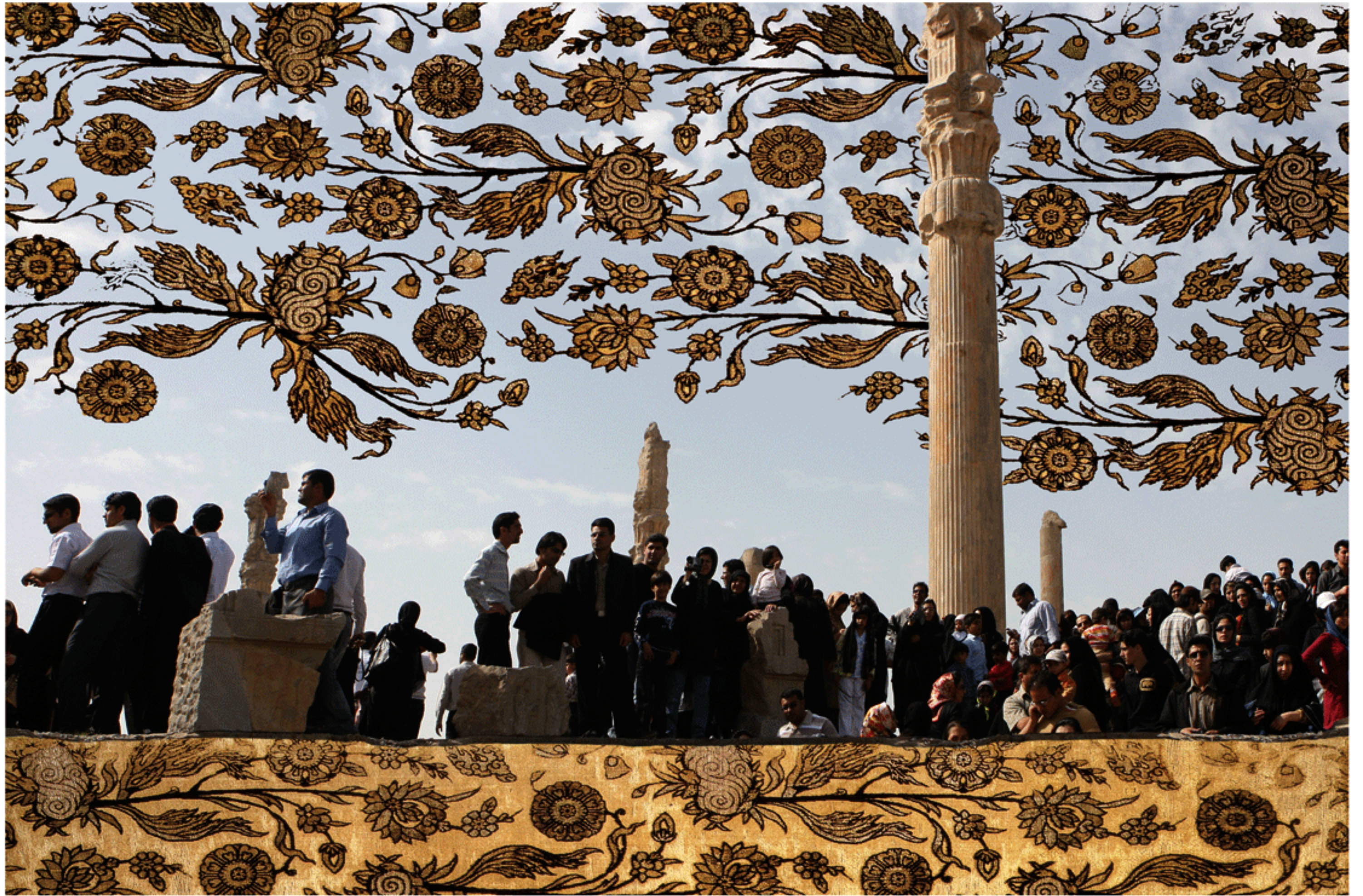
#1 - 75 x 112 cm